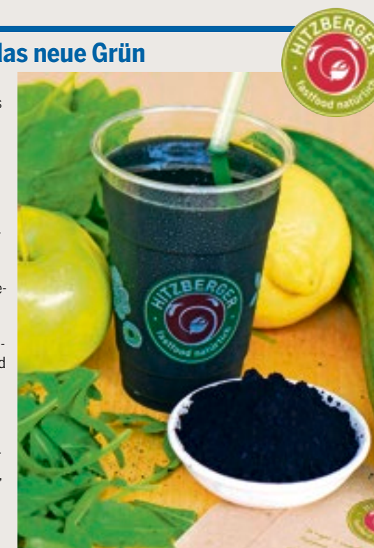
Black Magic: Aktivkohle liegt hoch im Trend.