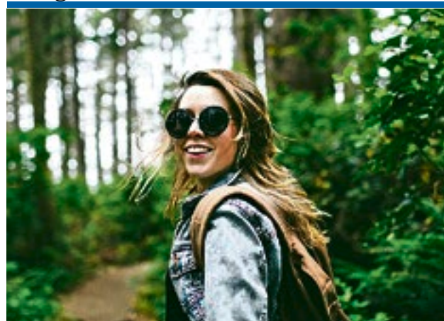
Fit und munter: Herbstzeit ist Wanderzeit.